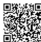
Accede al espacio HazFarma

“Incluir al farmacéutico dentro de los agentes implicados en el proceso de recuperación es clave para incrementar el índice de mayor adherencia”